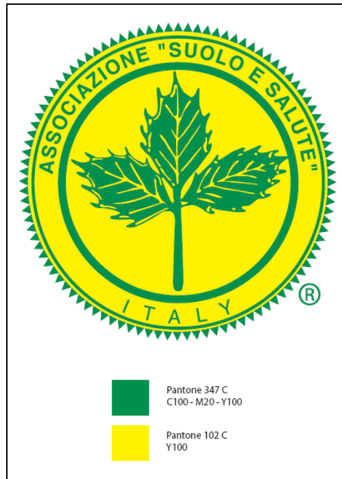
Fig. 1 Logo a colori con pantone

Il logo di Suolo e Salute srl è costituito da un rametto recante tre foglie di agrifoglio ( Ilex aquifolium ). Il rametto è circoscritto da un cerchio ispessito verso l'interno, mentre verso l'esterno si trovano due cerchi ravvicinati, uno sottile e il più esterno reca delle zigrinature e merlature tutto attorno. Tra il cerchio ispessito e i due esterni si trovano due scritte, quella rivolta verso l'alto "Associazione Suolo e Salute" quella rivolta verso il basso: "Italy".