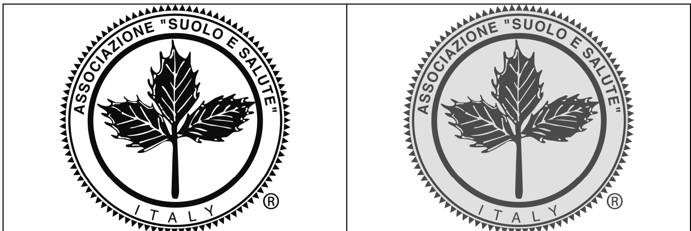
Fig. 2 Logo B/N e Grigio

Per i processi di stampa monocromatica in cui esistano sull'imballaggio indicazioni in un unico colore è possibile utilizzare il logo di Suolo e Salute in questo stesso colore.